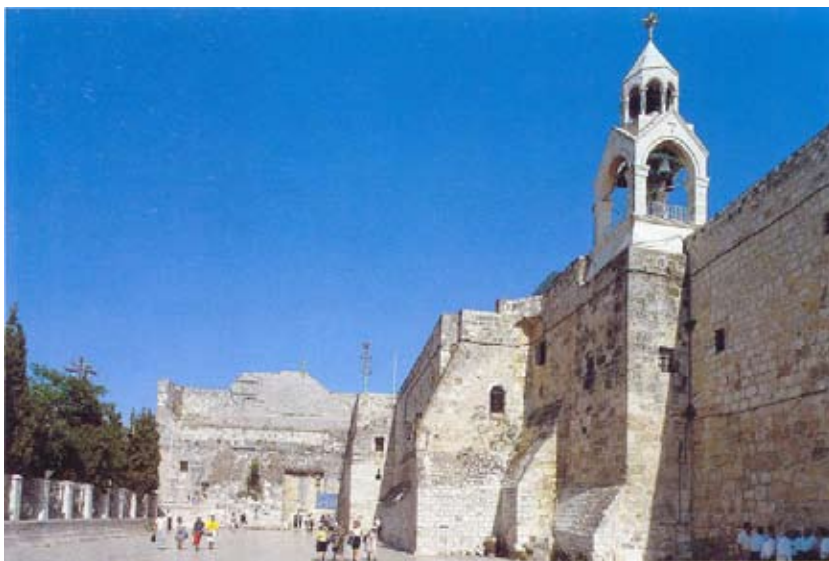
Вифлеем. Базилика Рождества.