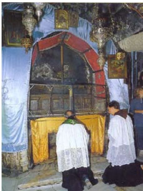
Вифлеем. Базилика Рождества. Богослужение.

Волнительно было посещение Вифлиема, места где родился Христос. Сама церковь Рождества сохранилась почти без изменений с IV века Р.Х. По преданию завоеватели не разрушили её, как остальные храмы, так как на мозаиках внутри базилики, были изображены волхвы, одетые в восточные одежды. Там служат армяне, католики и греки. Сама пещера Рождества находится над главным алтарем, и на месте, где родился Спаситель находится 14-ти конечная звезда, символ - Вифлиемской звезды. Местночитимая икона Богородицы Вифлиемская,