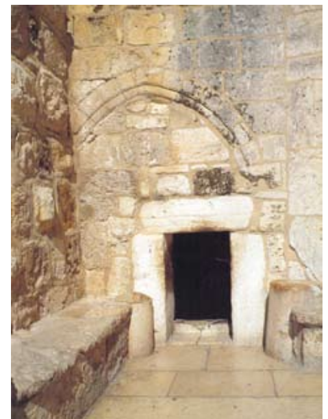
Вифлеем. Врата Смирения