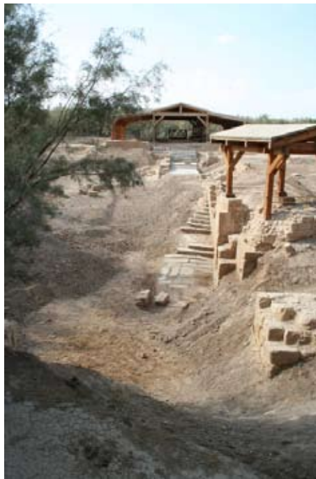
Река Иордан. Место крещения.