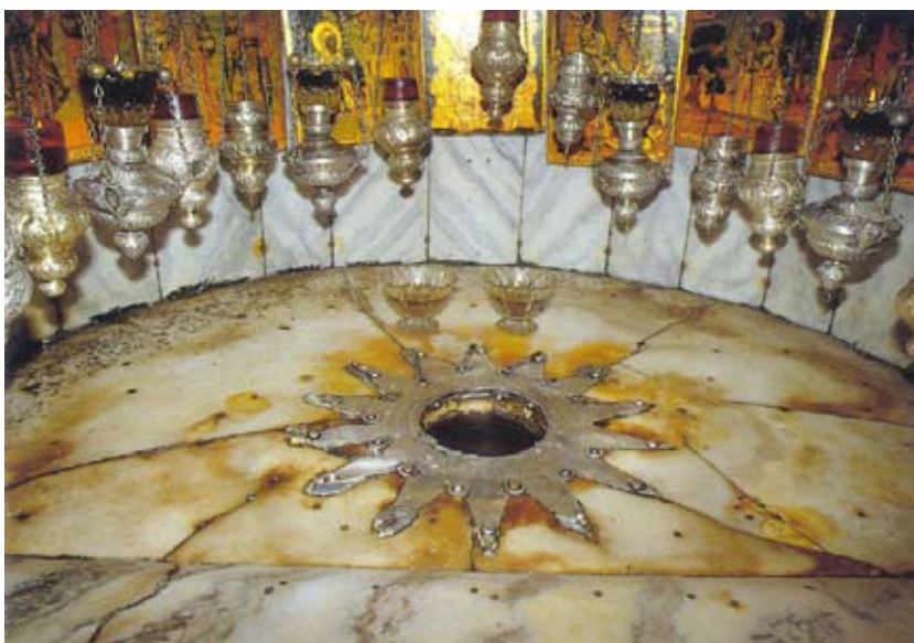
Вифлеем. Базилика Рождества. Место рождения Иисуса Христа