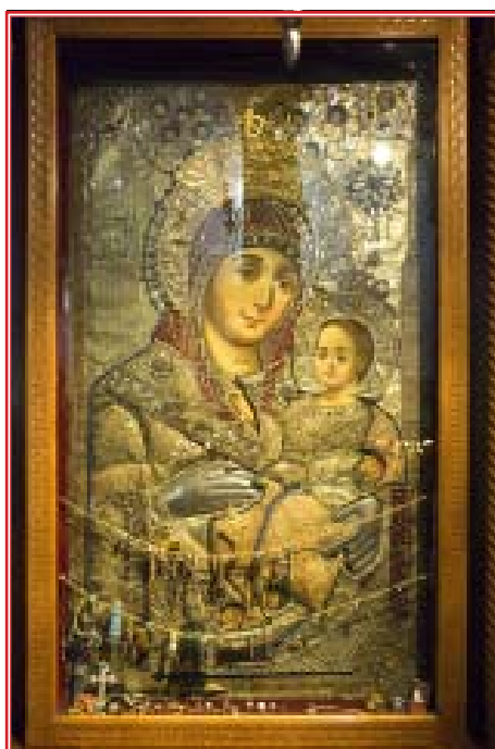
Чудотворный образ Вифлеемской иконы Божьей Матери

здесь еще крестоносцы; деревянный настил пола скрывает древнее