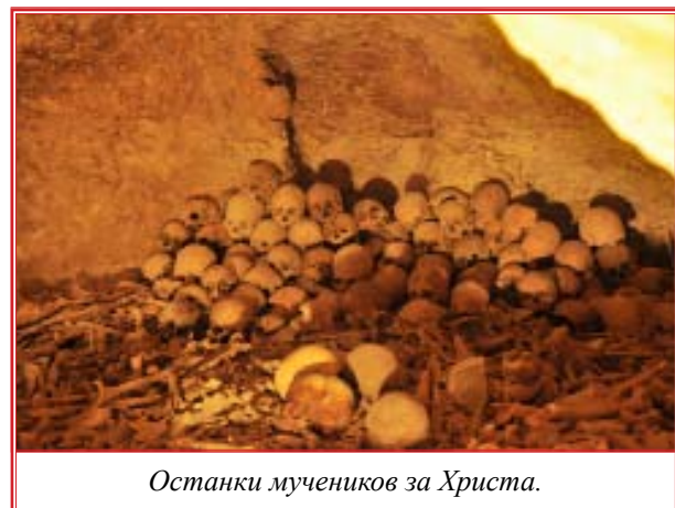
Останки мучеников за Христа.

Войдя внутрь храма, и чувствуя прохладу древних камней, открывается вид на два ряда высоких колон, которые воздвигли