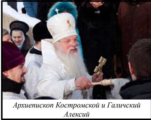
Архиепископ Костромской и Галичский Алексий

Этой осенью ушли от нас в небесные обители очень дорогие нам люди.