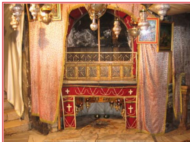
Базилика Рождества. Место рождения Иисуса Христа

Пещера Рождества — не единственная в этой местности. В комплекс храма Рождества Христова входит пещера Избиенных младенцев. Спустившись в эту пещеру, появляется более полное представление об устройстве первых христианских катакомбных храмов. В ней находится самый древний сохранившийся престол в Вифлееме (IV век). Здесь покоились мощи святых мучеников, младенцев