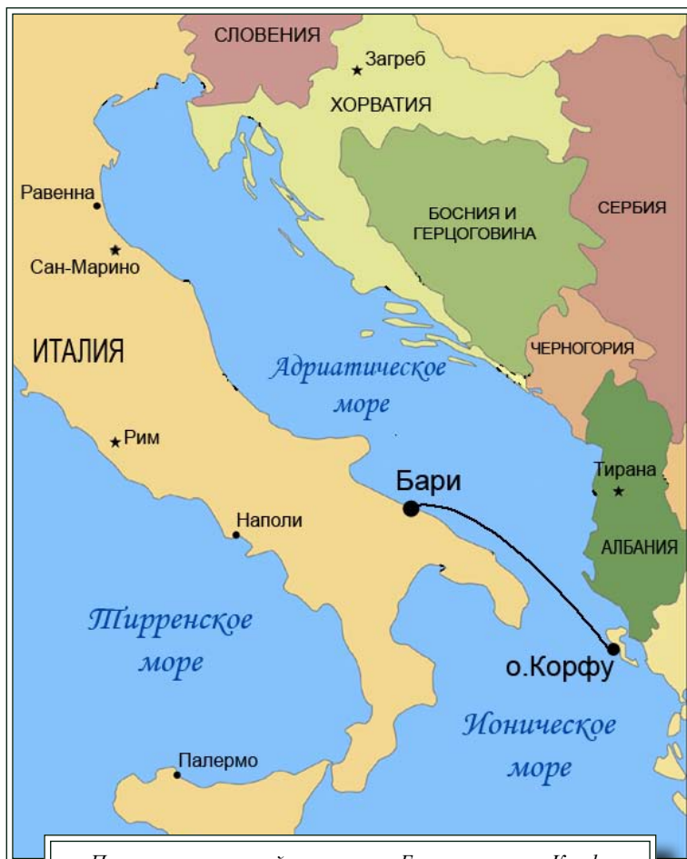
Путь паломнической группы из г.Бари на остров Корфу