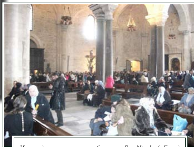
Исповедь и причащение в базилике San Nicola (г.Бари)