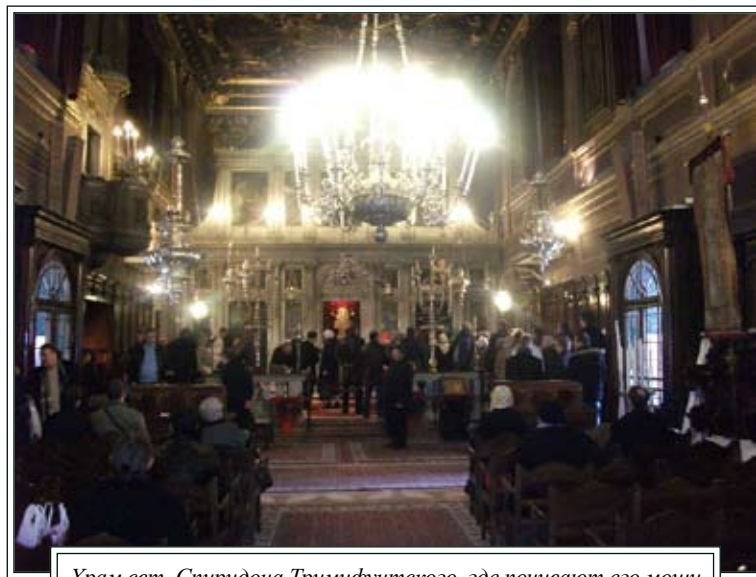
Храм свт. Спиридона Тримифунтского, где почивают его мощи