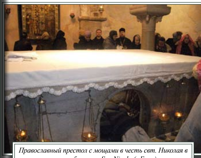
Православный престол с мощами в честь свт. Николая в крипте базилики San Nicola (г.Бари)