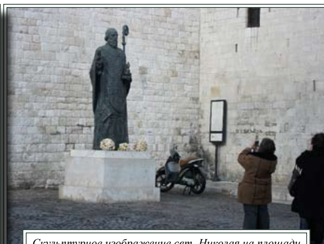
Скульптурное изображение свт. Николая на площади перед базиликой San Nicola (г.Бари)