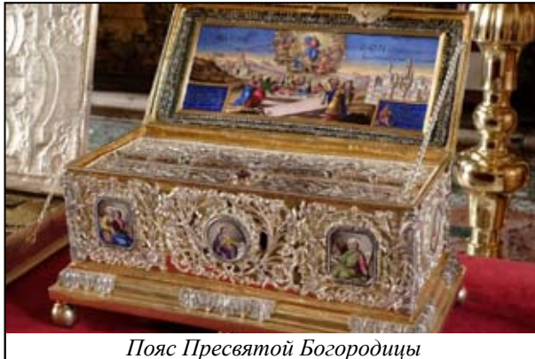
Пояс Пресвятой Богородицы

Некогда шайка разбойников вознамерилась разграбить Ватопед. Высадившись на берег ночью, они укрылись в кустах, чтобы утром неожиданно ворваться в обитель, однако игумен монастыря услышал