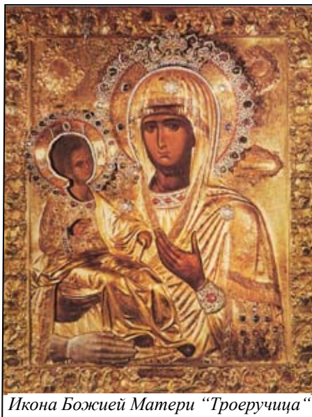
Икона Божией Матери “Троеручица”

перед службой, выстукивая деревянным молотком ритмичную дробь, а затем бьет в железную скобу или колокол, висящие там же.