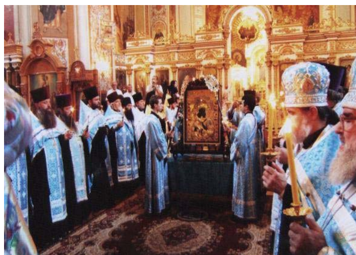
Феодоровская икона в Свято-Екатерининском кафедральном соборе Краснодара