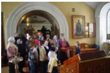
На экскурсии в верхнем храме