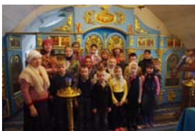
У Введенского придела нижнего храма