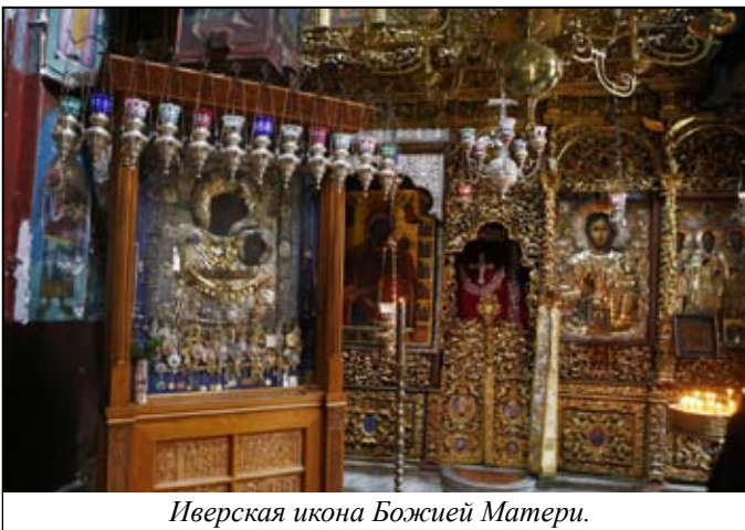
Иверская икона Божией Матери.

быть охраняема вами, а хочу быть вашею Хранительницею. Доколе будете видеть образ Мой в обители сей, доколе благодать и милость Сына Моего к вам не оскудеют”. Тогда чудотворную икону поместили над воротами обители и стали называть “Вратарница”. Однажды во время сарацинского набега один