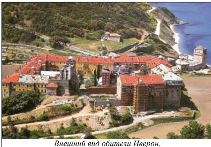
Внешний вид обители Иверон.

раки, лукумом и стаканом холодной воды, так повелось издревле. Устав в Свято-Пантелеимоновом монастыре строгий, афонский. Паломники наравне с монахами обителями участвуют во всех богослужениях. Службы здесь совершаются круглосуточно, с перерывами на сон