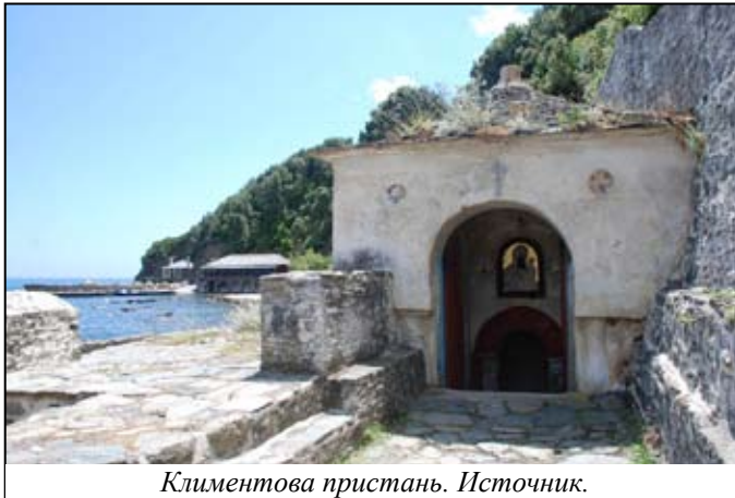
Климентова пристань.

храм Успения Пресвятой Богородицы. Икону поместили в алтаре храма Иверского монастыря, но на утро она оказалась над воротами обители. Так продолжалось несколько дней. Мать Божия явилась во сне старцу монастыря и сказала: “Я не желаю