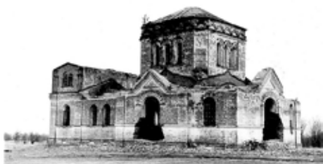
Богородицерождественская церковь. Фото 1955г.

«В 60-е годы XIX столетия в 16 верстах от Костромы Богоявленско-Анастасиин женский монастырь создал так называемую Назаретскую пустынь - своего рода пригородное монастырское хозяйство. В 80-е годы XIX в. в пустыни