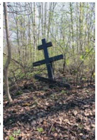
Бывшее монашеское кладбище. Настоящее время