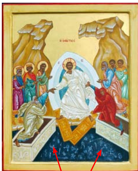
На иконе «Сошествие Христа во ад» ключи от ада изображаются, брошенными под ноги Спасителя

Поэтому, казалось бы, что ключи от ада находятся у противника Бога, у сатаны, но каждый сам выбирает пользоваться ими или нет. Выбрать жизнь или смерть, благословение или проклятие. Поэтому злая воля (намерения и желания человека) и есть ключи от ада.