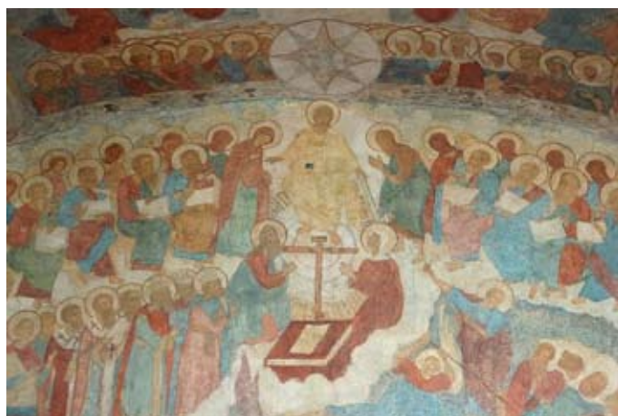
Гурий Никитин. Страшный суд. Фрагмент. Троицкий собор Ипатьевского монастыря. 1684г.

Особенностью артели было то, что Гурий Никитин не только руководил росписью. Он сам выполнял наиболее ответственную работу, даже